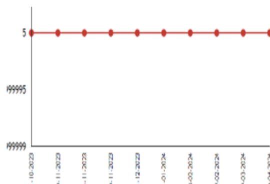
Μ.6 Συμπεριφορά ανάλογη του πλαισίου